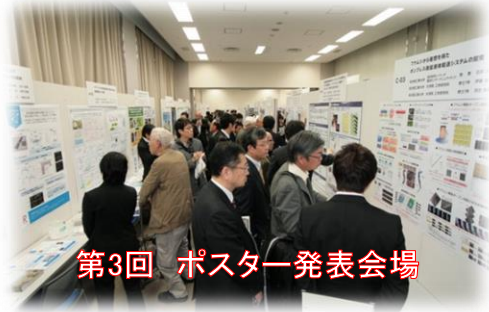
第3回 ポスター発表会場

技術シーズと企業の皆様(ニーズ)との出会いが「マッチング(実用化)のキッカケ」となります。是非とも皆様お誘い合わせの上、ご参加(ご支援)下さいますようお願い申し上げます。